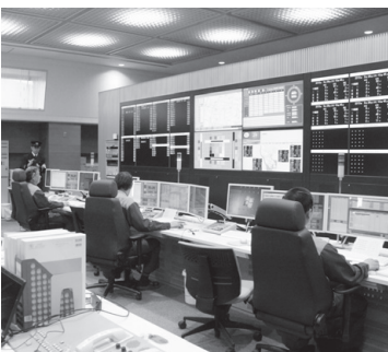
▶海部地方消防指令センター(十四山支所)