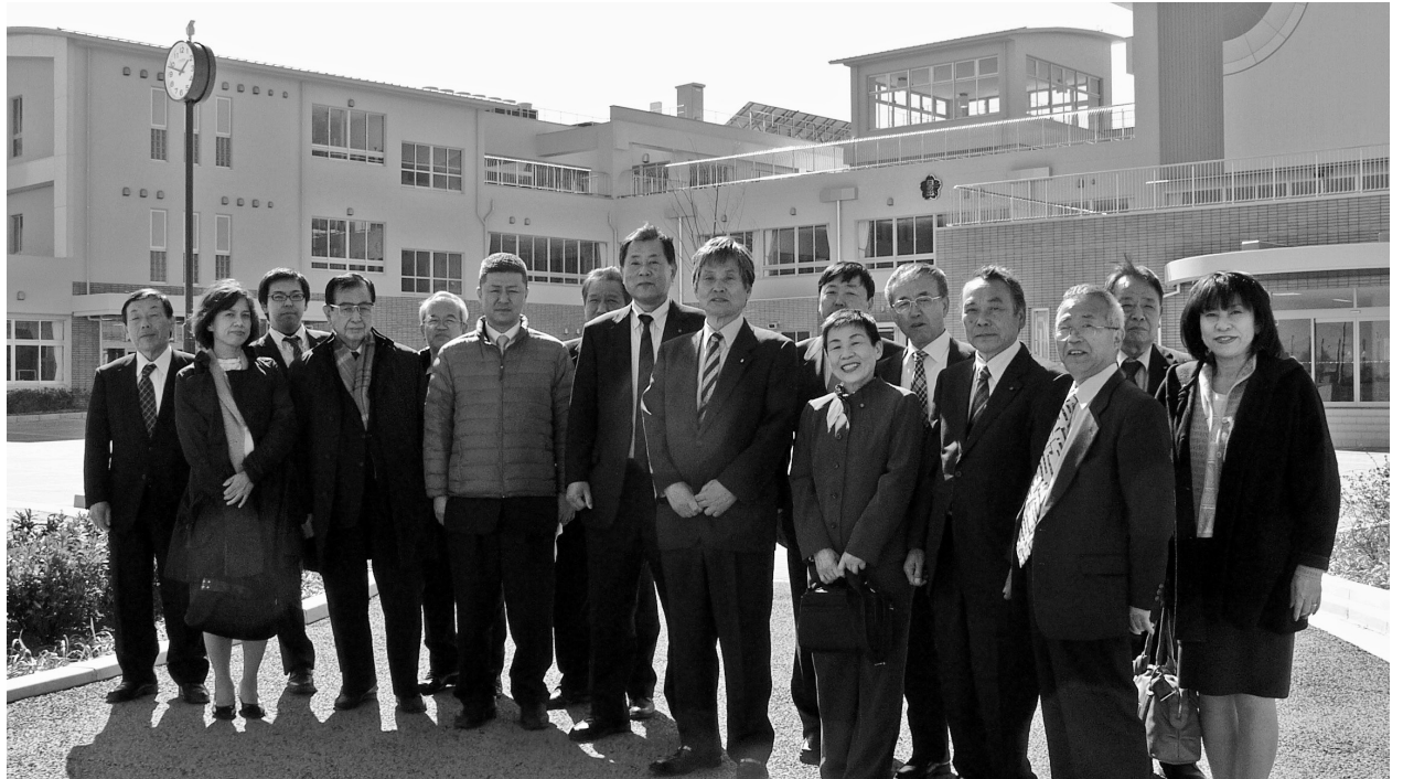
▶竣工した日の出小学校を 見学する議員【3月11日・平島町地内】