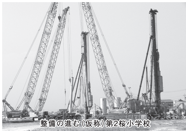
整備の進む(仮称)第2桜小学校

が、区画整理事業を進める ための地権者合意が得られ なかったと聞いている。 平成20年に当時の区長と 協議したが、①道水路等の 用地が少ないため、減歩