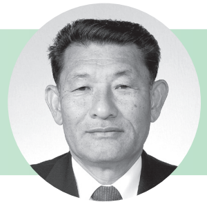
山本 芳照 議員