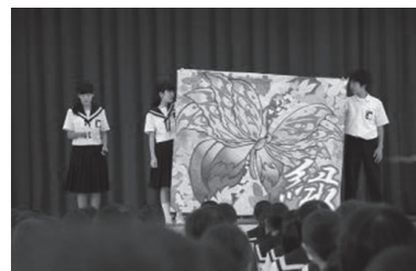
【ブロック旗の発表】