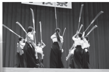
【なぎなた部の発表】