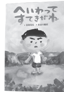
●へいわってすてきだね 安里有生/著

ホームページ用アドレス http://www.yatomi-library.com 携帯用アドレス https://lilod001.apse.jp/city-yatomi-lib/wopc/pc/m5rv