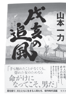
●戌亥の追風 山本一力/著