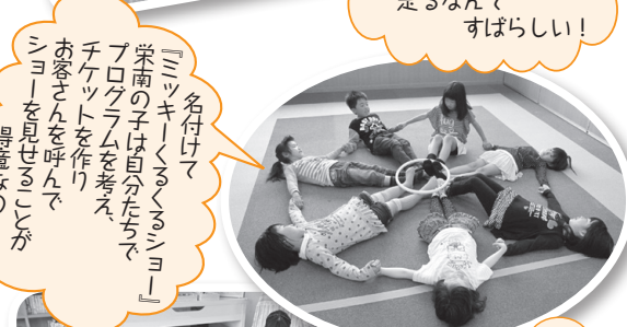
「名付けて 『ミッキーくまのシヨ!』 栄南の子は自分たちで プログラムを考え チケットを作り お客さんと呼んで シヨを見せることが 得意なの!」