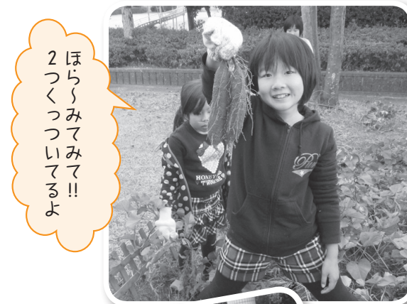
2ほらつくつみてみるよ

弥富の市街地よりはちょっと遠い所ではありますが、田舎の空気を吸いに栄南児童館まで出かけてきませんか!笑顔でお迎えしま〜す!