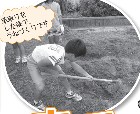
草取りを した後で、 うねづくりです