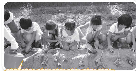
「おもいできるかなあ」 「大きなおもになりますように!」

※なかよしひろばは 月～金 9:30～11:30 14:00～16:00 (注)わくわくベビー・キッズ・チャイルド・フレンズ・マタニティー開催時は午前中お休み ※4月からさくら児童館の隣に移転しました。 ※詳しいことは、各子育て支援センターにお問い合わせください。