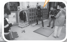
「よしまわった」 お正月には、 恒例のこままわし。 高学年の男の子は こまもなりこまも なんのその!