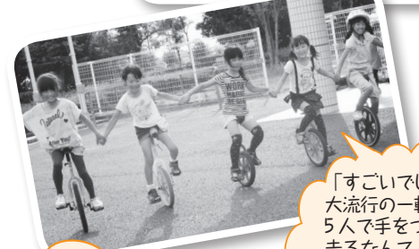
「すごいでしょー!!!」 大流行の一輪車。 5人で手をつないで 走るなんて すばらしい!