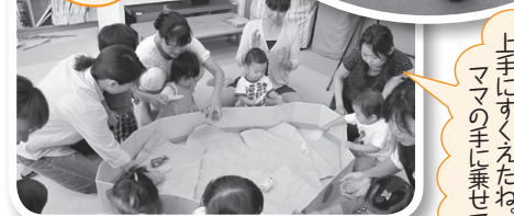
「金魚さん おいでおいで」 親子教室で金魚すくい。 上手にすくえたね。 ママの手に乗せて!