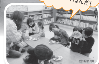
これは恋する フォーチュンクッキーの シヨだよ。 すべて内容は オリジナルです!