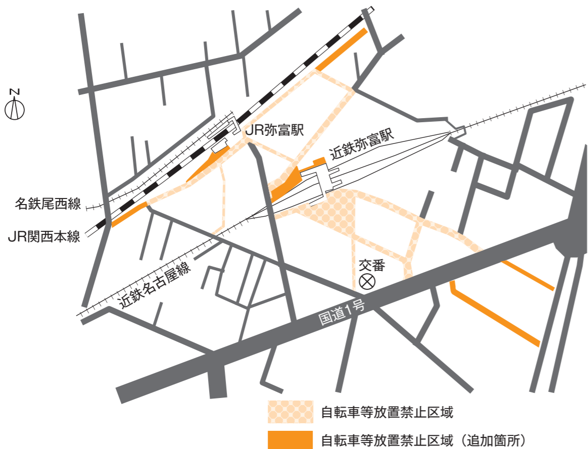
弥富駅周辺自転車等放置禁止区域図