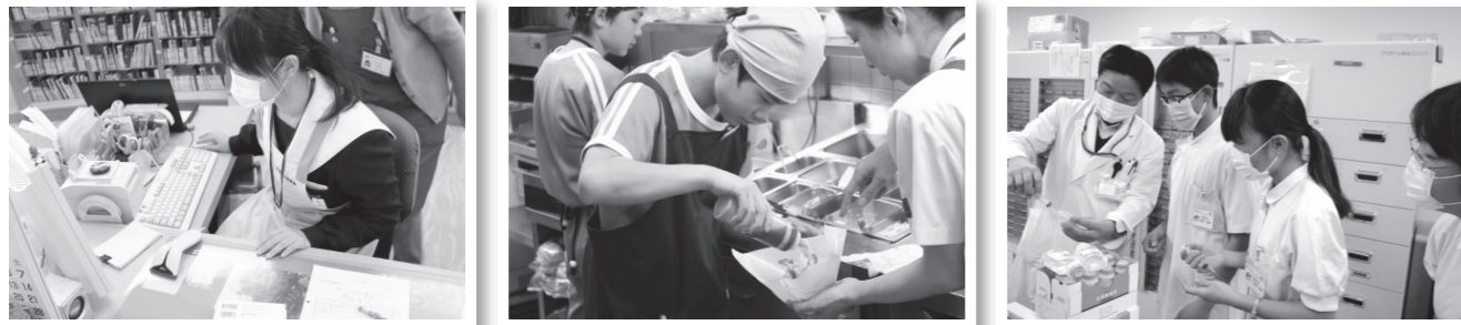
2年生が職場体験学習を行いました。3日間、働くことの意義を体感することができました。