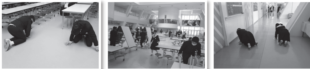
1・2年生が3年生と共に清掃に向かう取り組みをしました。3年生の熱心な姿から多くのことを学びました。