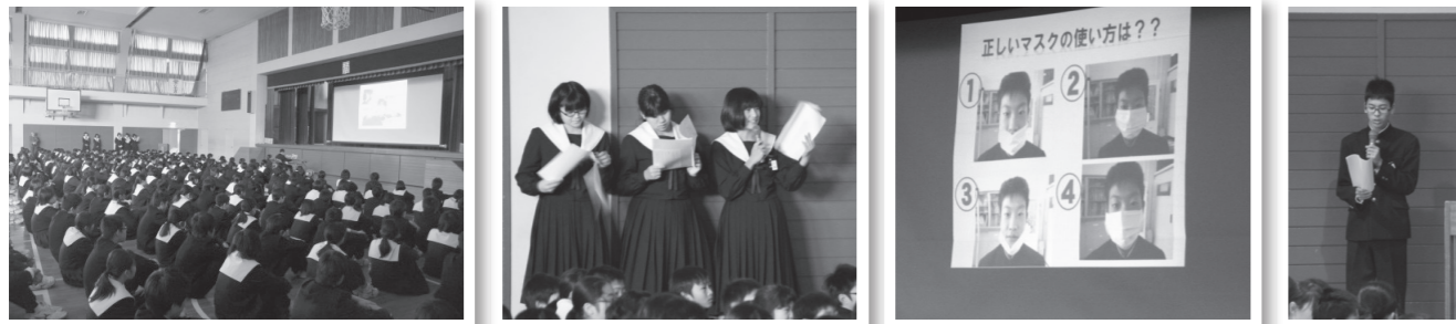
インフルエンザの流行を前にして、全校で予防と対策を学び合いました。