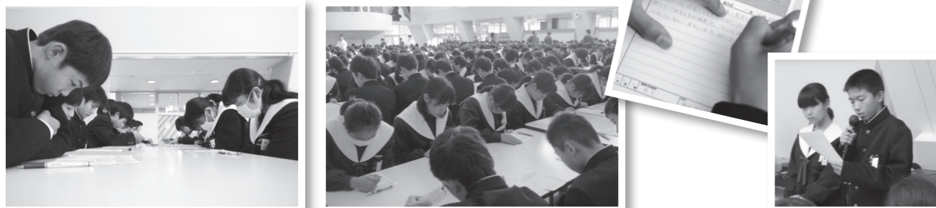
普段行っている清掃をおたがいにふりかえりました。それぞれに気づきを得た機会となりました。