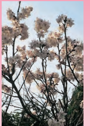
さくらんぼの花 (五明)

講演中には実際に体を動かし、歪みの少ない体やストレスを軽減するための運動も行われました。講師が客席で直接アドバイスする一幕もあり、参加者の皆さんは動きを身に付けられた様子で、生活に取り入れたいという声も聞こえました。