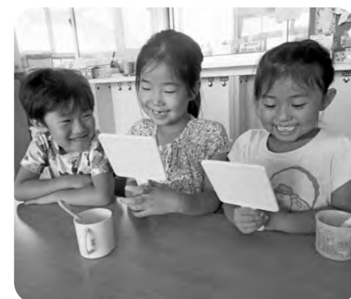
歯っていろいろな形してるんだね

十四山っ子達は昼食をいただく前に一口ご飯を口に入れて20回噛んでいます。噛む力を養うだけでなくご飯の甘さや旨みを感じ、食育にもつながっています。