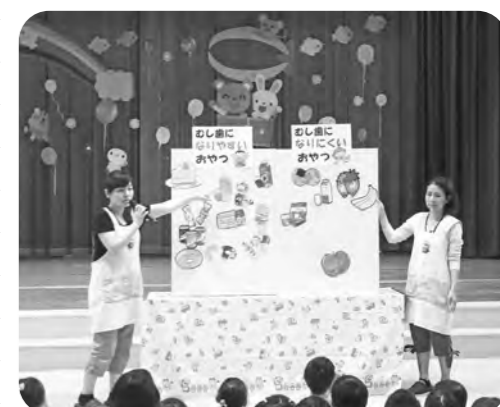
よい子の歯みがき教室

元気な歯を育てる為の取り組みに食後の歯磨きと保育士が行う仕上げ磨きがあり1人ずつ丁寧に磨き残しを補っています。更に歯科検診や5歳児が行うフッ化物洗口、歯科衛生士による歯磨き教室にも参加しています。