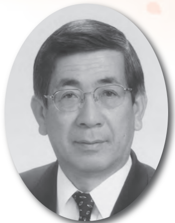
弥富市長 服部彰文