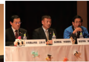
シンポジウムの様子