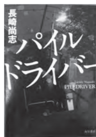
パイルドライバー 長崎 尚志/著

ホームページ用アドレス http://www.yatomi-library.com 携帯用アドレス https://llisod001.apse.jp/city-yatomi-lib/wopc/pc/m5rv