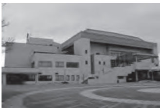
総合社会教育センター

市役所事務室の仮移転に伴い市役所申告会場が変更になります。 今回の変更に伴い、市民の皆様にはご不便をおかけすることになりますが、ご理解とご協力をお願いいたします。