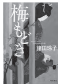
梅もどき 諸田 玲子/著