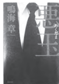
悪玉 鳴海 章/著