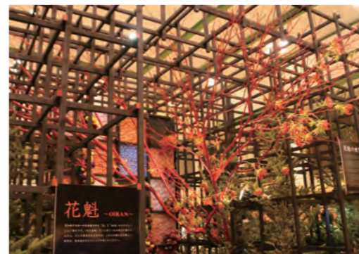
開場中央に飾られたオブジェ「花魁」

11月25～27日、総合社会教育センターであいち花フェスタ2016が開催されました。これは、花の生産高が日本一の愛知県をPRする催しで、4回目となる今回は海部地域で生産されている花に親しんでいただくことから、今年度市制10周年となる弥富市での開催となりました。