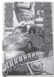
脇坂副署長の長い一日 真保 裕一/著