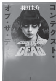
コンテクト・オブ・ザ・デッド 羽田 圭介/著

ホームページ用アドレス http://www.yatomi-library.com 携帯用アドレス https://lilod001.apse.jp/city-yatomi-lib/wopc/pc/m5rv