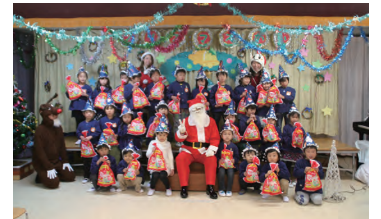
サンタと一緒にメリークリスマス!

西部保育所では、所児からサンタやトナカイに、「トナカイはどうやって飛ぶのですか?」など質問がありました。また、所児らはプレゼントのお礼に、クリスマスの歌を歌ったり、手作りのプレゼントを渡したりと、とても楽しいクリスマス会となりました。