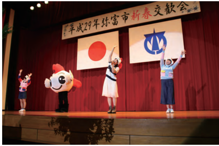
劇団アルクシアターの劇団員による歌の披露