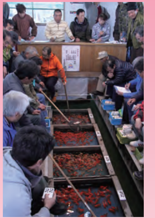
金魚初市 (東海観賞魚卸売市場)