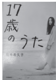
17歳のうた 坂井 希久子/著