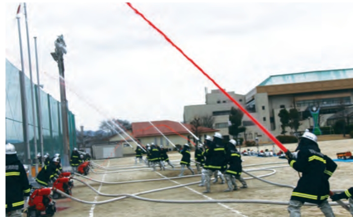
消防団による放水訓練

また、8つの分団による一斉放水を実施し、消防団員として使命達成の決意を新たにするとともに、今年一年の平穏を祈願しました。