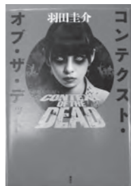
コンテクト・オブ・ザ・デッド 羽田 圭介/著

ホームページ用アドレス http://www.yatomi-library.com 携帯用アドレス https://lilod001.apse.jp/city-yatomi-lib/wopc/pc/m5rv