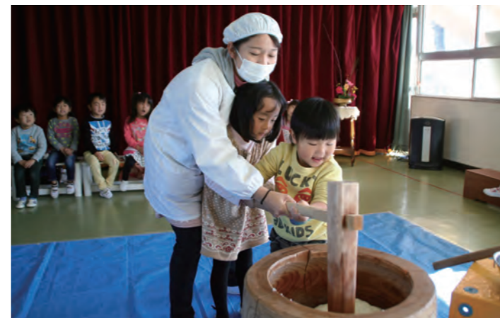
先生と一緒にもちをつく所見