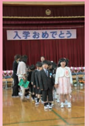
小学校入学式 (十四山西部小学校)