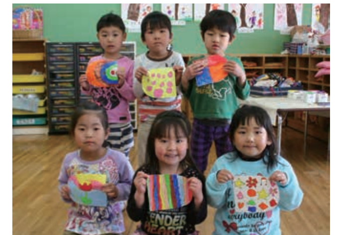
できあがったウロコを持ってハイチーズ

4月13日、弥生保育所の年長の所児らが、「こどもの日の集い」にむけて、こいのぼりのウロコの色塗りを行いました。所児らはそれぞれ、自分の好きな色や模様を塗り、カラフルなウロコができあがりました。所児らのこいのぼりは、4月28日の「こどもの日の集い」で披露されるとのことです。