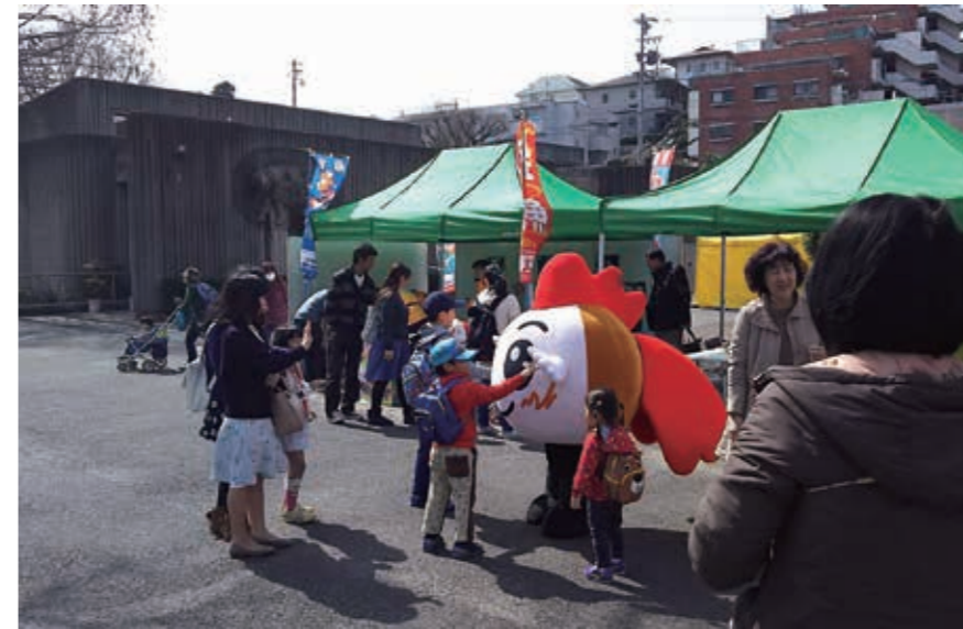
市のブースときんちゃんに集まる子どもたち

2月には、総合的な学習の時間を使って、校内で起きたけがの件数や種類から、統計的手法を用いてその因果関係を探り、今後の予防策について各クラスで話し合いました。