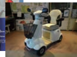
寄贈された電動シニアカー