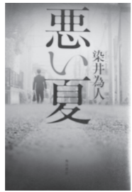
悪い夏 染井 為人/著