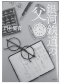
銀河鉄道の父 門井 慶喜/著