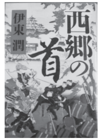
西郷の首 伊東 潤/著

ホームページ用アドレス http://www.yatomi-library.com 携帯用アドレス https://lilod001.apse.jp/city-yatomi-lib/wopc/pc/m5rv