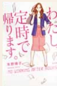
わたし、 定時で帰ります。 朱野 帰子 / 著

ホームページ http://www.yatomi-library.com 携帯用HP http://lisod001.apset.jp/city-yatomi-lib/wopc/pc/mSrv 市立図書館 ☎65-1117