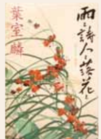
雨と詩人と落花と 葉室 麟 / 著