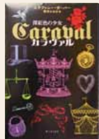
カラヴァル 深紅色の少女 ステファニー ガーバー / 著