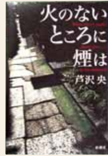
火のないところに煙は 芦沢 央 / 著