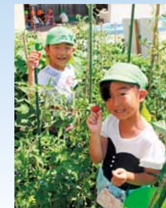
夏野菜の収穫 (ひので保育所)

市ホームページ内フォトギャラリーや公式ツイッターでもまちの話題を紹介しています!