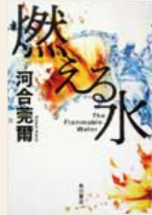
燃える水 河合 莞爾 / 著