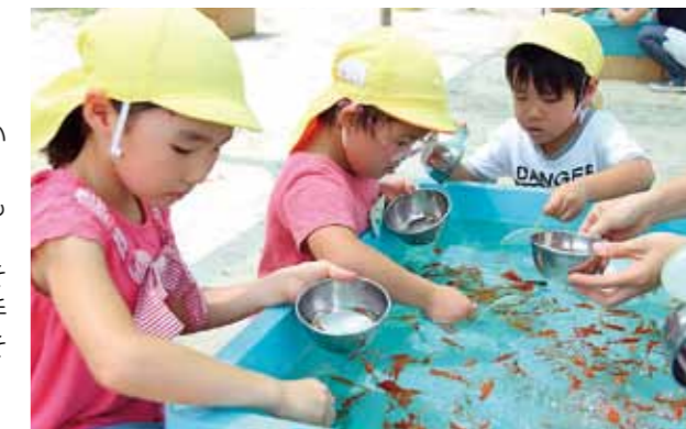
金魚すくいに挑戦する子どもたち(十四山保育所)

★ 子どもたちは、慣れないポイに悪戦苦闘しながら楽しそうに金魚すくいをしました。「たくさんすくえた!」「上手にできなかったけど凄く楽しかった」など、とても嬉しそうでした。