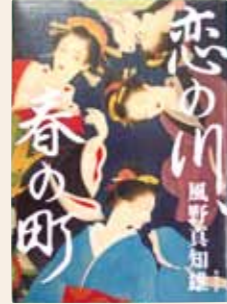
恋の川、春の町 風野 真知雄 / 著