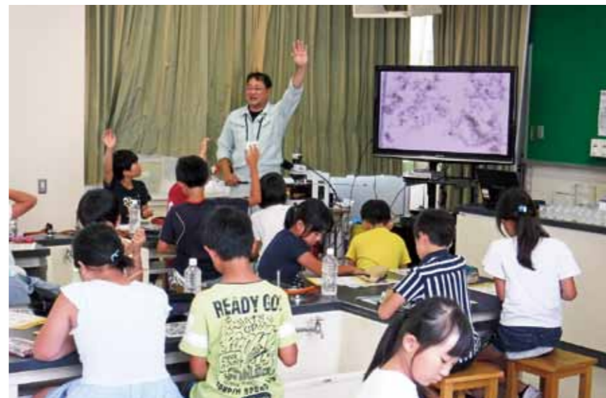
微生物の名前を当てるクイズをしている様子