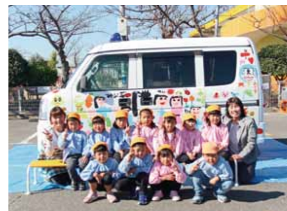
青パトと一緒に記念撮影