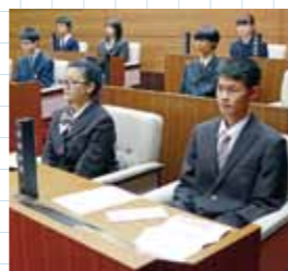
真剣な表情をする高校生議員