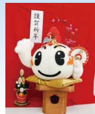
▲謹賀新年 (きんちゃん)

8月21日に平島町で住宅火災が起きた際、平島西地区防災会会員ら数人は地元消防団員と協力し、消火栓にホースをつなぎ放水して初期消火にあたり、他の建物への延焼が大規模になるのを防ぎました。