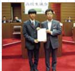
意見書を提出する小鹿議長