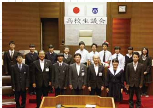
参加した高校生議員と市長、副市長、教育長

まちづくり委員・防災委員・観光委員の各委員が勉強会で作成した意見書を弥富市本会議場で発表しました。各発表には市長、副市長、教育長から講評がありました。発表のあった意見書は弥富市高校生議会で提出の可否が採決され、模擬選挙で選出された小鹿議長から市長へ提出されました。