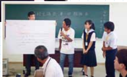
各委員会の意見発表