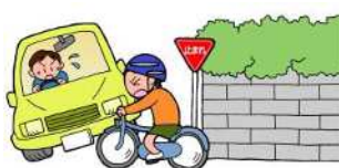
交差点での一時停止と安全確認