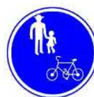
自転車及び歩行者専用標識