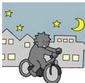
夜間はライトを点灯