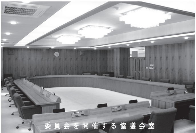
委員会を開催する協議会室