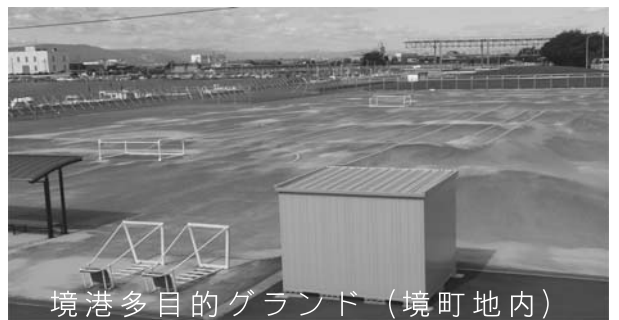
境港多目的グラウンド(境町地内)

(1) 市南部にあるのに北部まで申請に行き、鍵を借りなければならぬ。 使い勝手がよいとは思えないがどうか。 (2) 今後の整備計画 (3) 工事中のフェンスは撤去するの。 (4) 利用者に、道や駐車場(の入り方)が分からないと聞いた。 使い勝手がよくなるように進めてほしいがどうか。