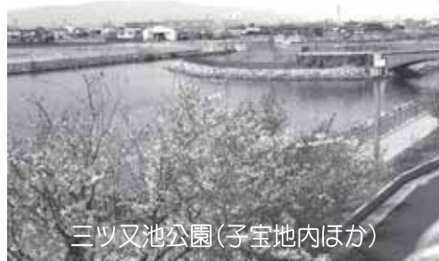
三ツ又池公園(子宝地内ほか)

図っていききたい。 (2) 県からの管理運営に関する負担金は無い。しかし、側面的な支援をもらい、今後も県へ協力を願うよう努力していききたい。