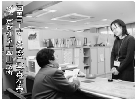
「図書コーナー」の設置(写真左奥)が予定される十四山支所