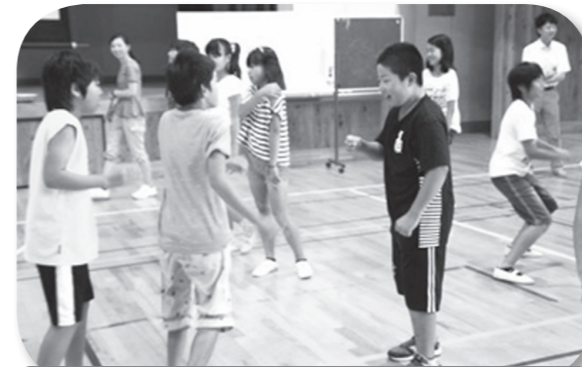
室内ゲームの様子