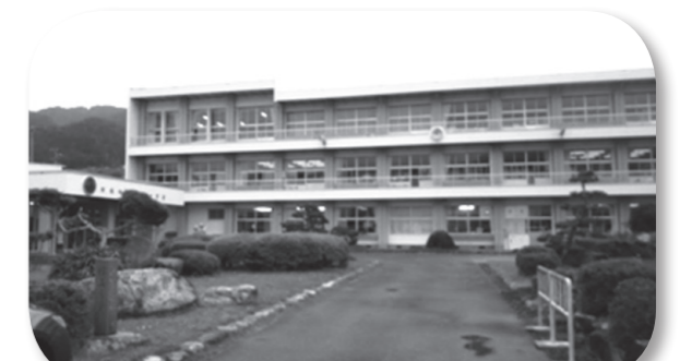
阿南町立新野小学校

れ合い、さらに親近感が高まりました。お互いのふるさとを理解し、見識を広めることができた実りの多い訪問になりました。