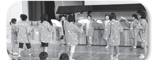
新野小 地域に伝わる盆踊りの発表