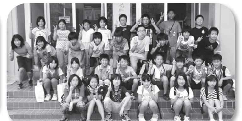
栄南小と新野小 全員で記念写真