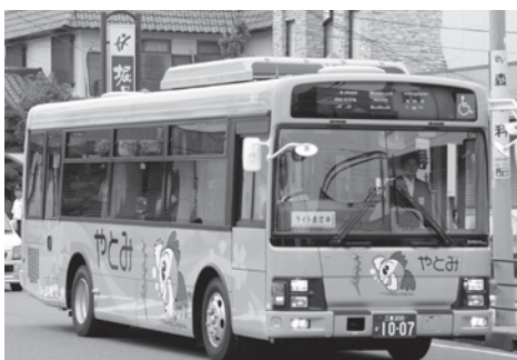
▶市内を走る「きんちゃんバス」

これについては、協議会の中で一つの考え方として大きく変化させていかなくはならない。来春協議会が開催されるので、それまでにしっかりと一度所管で議論をしていきたいと思っ