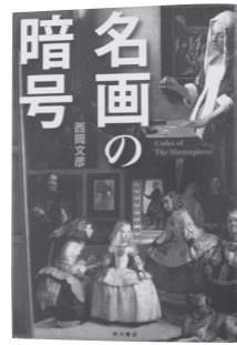
名画の暗号 西岡 文彦/著