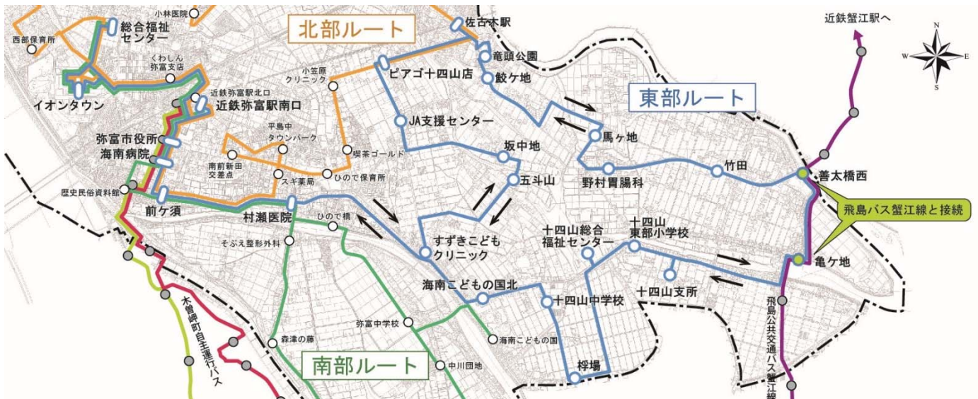
きんちゃんバス路線図 (青い線が東部ルート)

これらを踏まえ、東部ルートについて、 運行本数を増やすための方法を検討しています