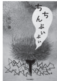
ちんぷいぷい 松山 巖/著