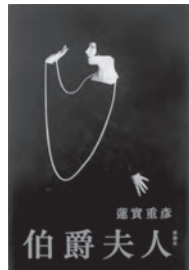
伯爵夫人 運實 重彦/著

ホームページ用アドレス http://www.yatomi-library.com 携帯用アドレス https://liliod001.apse.jp/city-yatomi-lib/wopc/pc/m5rv