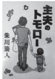
主夫のトモロー 朱川 湊人/著