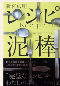
レシピ泥棒 新宮 広明 / 著