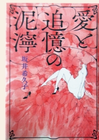
愛と追憶の泥凪 坂井 希久子 / 著