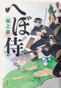
へぼ侍 坂上 泉 / 著

ホームページ http://www.yatomi-library.com 携帯用HP http://ilisod001.apse.jp/city-yatomi-lib/wopc/pc/mSrv 市立図書館 ☎65-1117