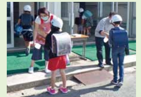
校内に入る前の消毒