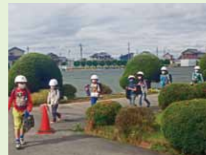
間隔をあけて登校