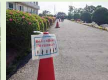
児童が止まる目印