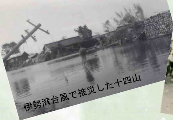
伊勢湾台風で被災した十四山