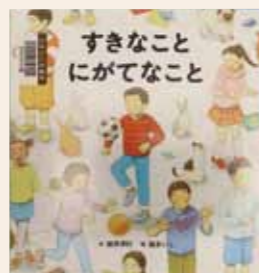
すきなことにがてなこと 新井 洋行 / 作