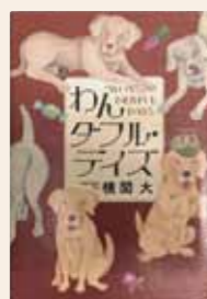
わんダフル・デイズ 横関 大 / 著