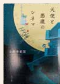
天使と悪魔のシネマ 小野寺 史宜 / 著

ホームページ http://www.yatomi-library.com 携帯用HP https://ilisd001.apse.jp/city-yatomi-lib/wopc/pc/mSrv 市立図書館 ☎65-1117