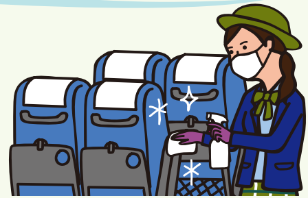
車内の消毒を徹底しています