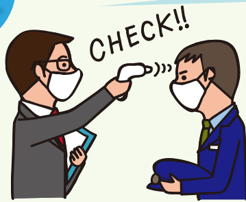
乗務員の体温をチェックしています