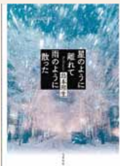
星のように離れて 雨のように散った 島本 理生 / 著