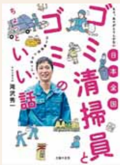
日本全国ゴミ清掃員と ゴミのちよつといい話 滝沢 秀一 / 著

ホームページ http://www.yatomi-library.com 携帯用HP https://lisod001.apse.jp/city-yatomi-lib/wopc/pc/mSrv 市立図書館 ☎65-1117