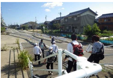
健康歩こう会下見会