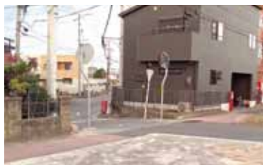
▲佐古木駅南口から国道1号に出る交差点のカーブミラー

問 佐古木投票所の案内を親切丁寧にすることは。 答 総務部長 次回よりわかりやすい案内表示を設置する。 問 佐古木公民館を借用している佐古木投票所以外は、全て市の公共施設であるが、投票所に使用可能な施設の選定は。 答 民間施設を含めて考えたいが、現在は未定。 問 潮見台・火葬場に向かう案内標識の改善をしては。 答 市民生活部長 当該道路に看板を設置するには、名古屋港管理組合と協議する必要がある。当面は、火葬場利用許可書の交付時に経路案内図を配布する。