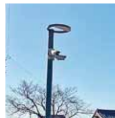
▲白鳥保育所駐車場の防犯カメラ