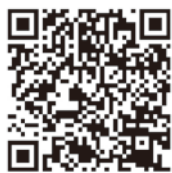
新型コロナウイルス感染症後遺症リーフレット(東京都)