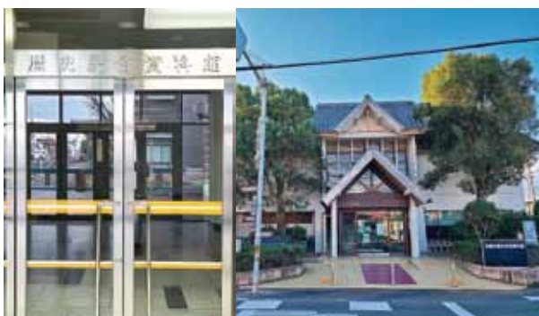
▲新歴史民俗資料館(左) 旧歴史民俗資料館(右)