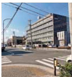
▲市役所北側交差点