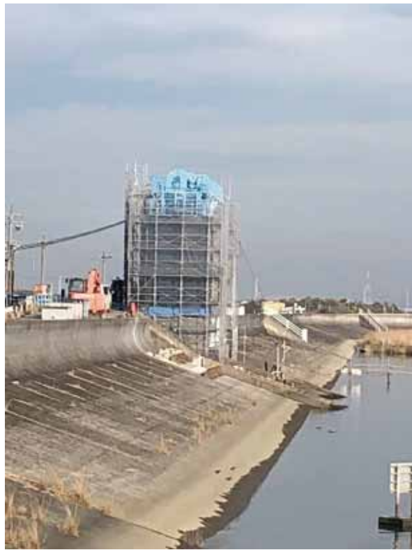
しもすいもん ▲鍋田川下水門

東日本大震災から10年が経過し、津波に対する危機意識が薄れてきているように感じる。本市において、いかなる自然災害が発生しても機能不全に陥らない指針となる「弥富市地域強靱化計画」について以下を問う。