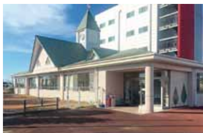
▲栄南児童館・児童クラブ