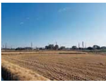
▲高台がない弥生学区北西部

問 「令和4年度中に、南部地区で公共交通のデマンド方式の社会実験を行う」の9月議会での答弁だったが、本格導入はいいつ頃か。どの地区を計画しているのか。 答 「9月議会の答弁は、あくまでも予定。社会実験や本格導入は、公共交通活性化協議会などで検討していく。」 問 市内小中学校の通学路の点検で、危険箇所は何か所見つかり、どのような対応を行うのか。 答 （教育部長）「危険箇所は85か所。重複もあるが、外側線舗装等13か所、横断歩道の引き直し等33か所、見守り強化等59か所。関係機関で協力して対策を行う。」 問 残土条例を制定する考えは。 答 （市長）「県条例策定後に、本市の条例について検討していきたい。」