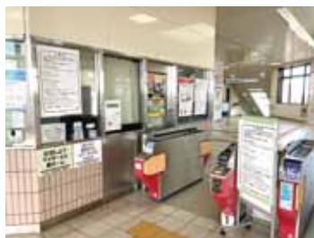
▲近鉄弥富駅改札口