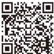
▲新型コロナウイルスワクチン接種済証再発行について