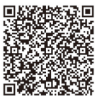
▲弥富市人口ビジョン(令和2年度改訂版)