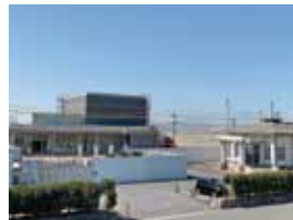
▲新火葬場(左) 旧火葬場(右)