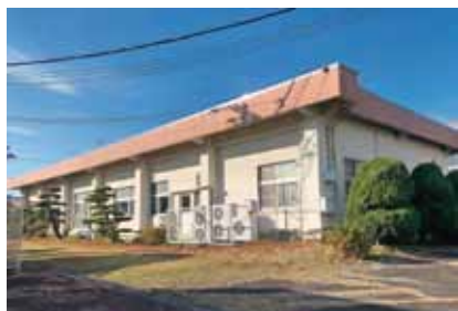
▲東部児童クラブ(十四山公民館内)

問 小学校統廃合についてPTA保護者以外の地域市民と、意見交換やアンケートをする考えは。