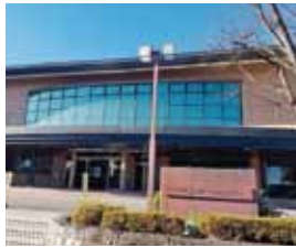
▲十四山スポーツセンター

答 令和4年1月より、事業者募集を行う。第1回目は十四山スポーツセンターとし、命名権料は年間30万円以上、契約期間は3年程度を考えている。