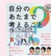
10歳からできる自分の あたまで考えること どう解く?制作委員会/著