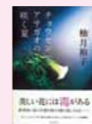
チョウセンアサガオの 咲く夏 袖月 裕子/著