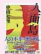
人面鳥 中山 七里/著