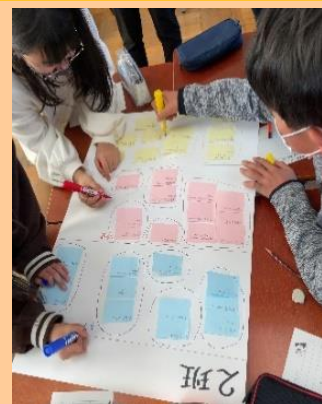
【期待・不安・要望の付箋を貼っている様子】

「人数が少ないことのメリット・デメリットの説明を聞いて弥富中と合体することになった理由がわかった」