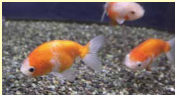
▲弥富生まれの新しい金魚サクラニシキ

弥富まちなか交流館1階ロビーに10月2日(日) YaToMi AQUA(弥富金魚水族館)がオープンしました。10の水槽に弥富の金魚が優雅に泳いでいます。