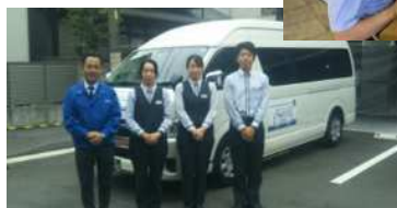
ドライバーのみなさま