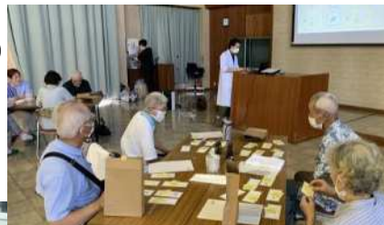
チョイソコイベントの様子