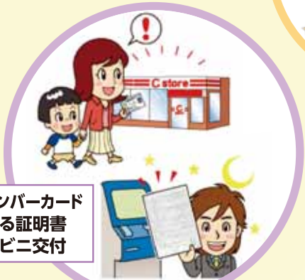
マイナンバーカードによる証明書コンビニ交付