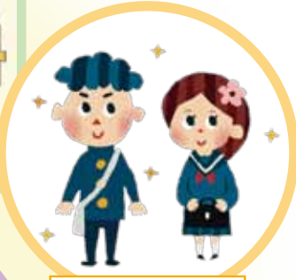
中学校新入生への入学祝金支給