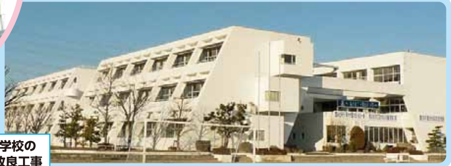
弥富北中学校の長寿命化改良工事