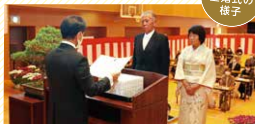
令和4年度 金婚式の 様子

申・問 市役所介護高齢課(内線175) 十四山支所 弥富市社会福祉協議会 ☎65-8105