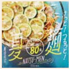
さっと!つるっと!夏麺 重信 初江/著