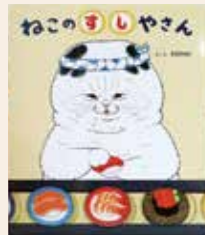
ねこのすし屋さん KORIRI/さく え