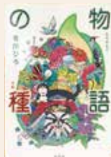
物語の種 有川 ひろ/著