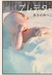
プレデター あさの あつこ 著