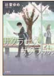
サクラサク、サクラチル 辻堂 ゆめ 著