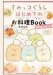
すみっこぐらしはじめての お料理Book 島本 美由紀 著