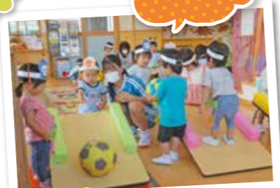
お姉さんも一緒に 夏まつり