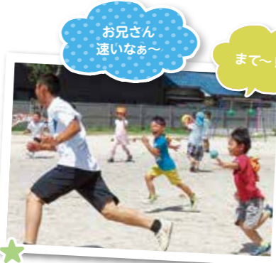
お兄さん 速いなあ~

5月、保育所の目の前の田んぼで5歳児が田植えの体験をさせていただきました。田んぼに足を踏み入れ「わ~!ヌルヌルする」と言いながら、苗を植えていきました。稲の成長を間近に見て、秋には稲刈りを体験させていただくことで、お米ができるまでを身近に知ることができ、食への関心を高めています。