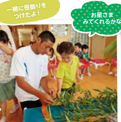
一緒に笹飾りを つけたよ!