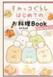
すみっこぐらしはじめての お料理Book 島本 美由紀 著