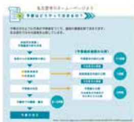
▲名古屋市のホームページより