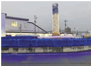
▲近鉄弥富駅南口ロータリー (イルミネーション)

問 市道の清掃ボランティア活動を把握しているか。 答 (建設部長) 把握している。