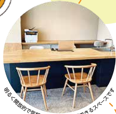
明るく開放的で気軽に立ち寄って相談できるスペースです