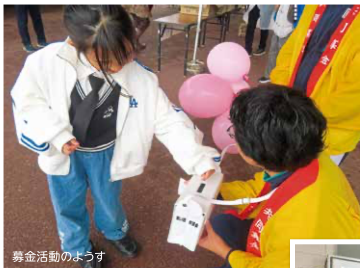
募金活動のようす