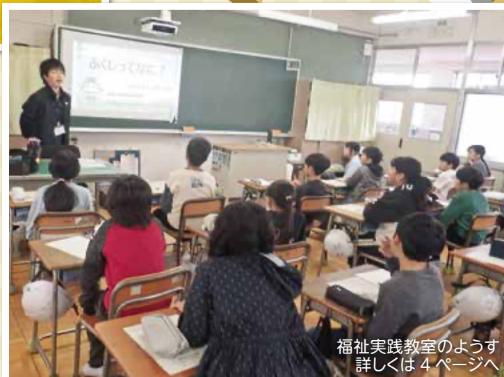
福祉実践教室のようす 詳しくは 4 ページへ