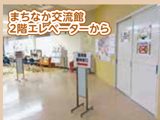
まちなか交流館 2階エレベーターから